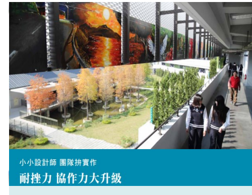
小小設計師 團隊拼實作 耐挫力 協作力大升級