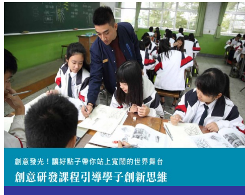
創意發光！讓好點子帶你站上寬闊的世界舞台 創意研發課程引導學子創新思維