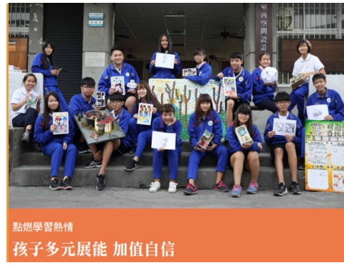
點燃學習熱情 孩子多元展能 加值自信