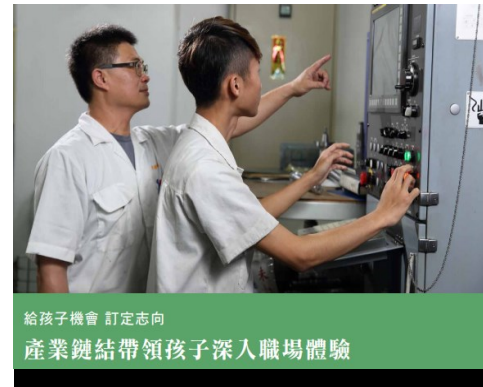
給孩子機會 訂定志向 產業鏈結帶領孩子深入職場體驗