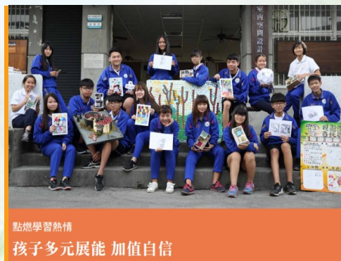
點燃學習熱情 孩子多元展能 加值自信