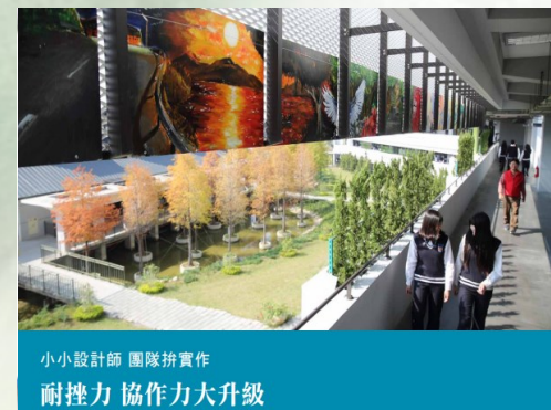
小小設計師 團隊拼實作 耐挫力 協作力大升級