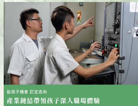
給孩子機會 訂定志向 產業鏈結帶領孩子深入職場體驗