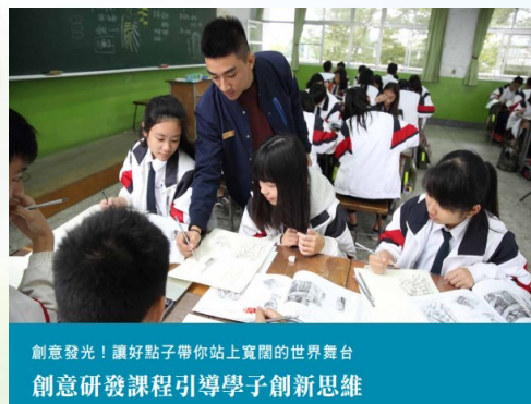
創意發光！讓好點子帶你站上寬闊的世界舞台 創意研發課程引導學子創新思維